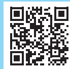
FORMULARIO DE INSCRIPCIÓN